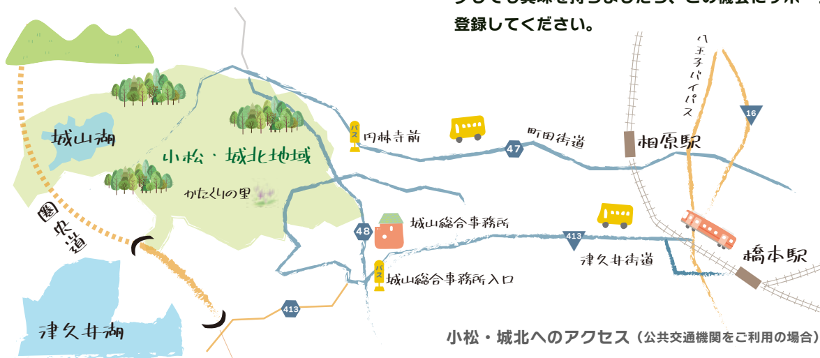
小松・城北へのアクセス(公共交通機関をご利用の場合)